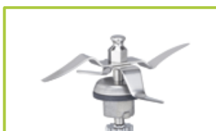
Pisau bancuh (tajam)