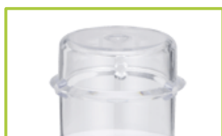
Tasse à mesurer