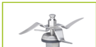
Couteau mélangeur (pointu)