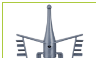
Outil de mélange