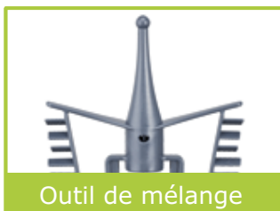
Outil de mélange