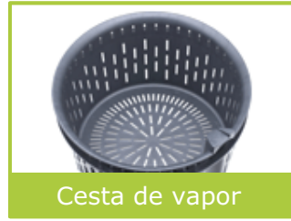
Cesta de vapor