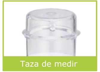
Taza de medir