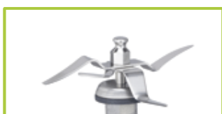
Μαχάιρι ανάμιξης (αιχμηρό)